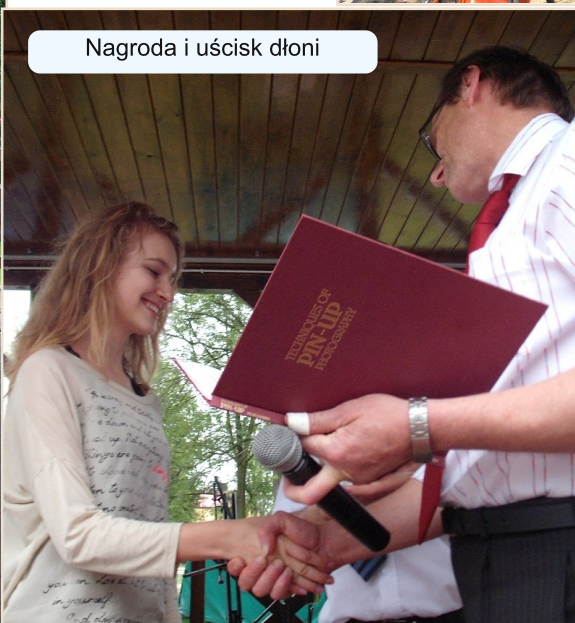
Nagroda i uścisk dłoni