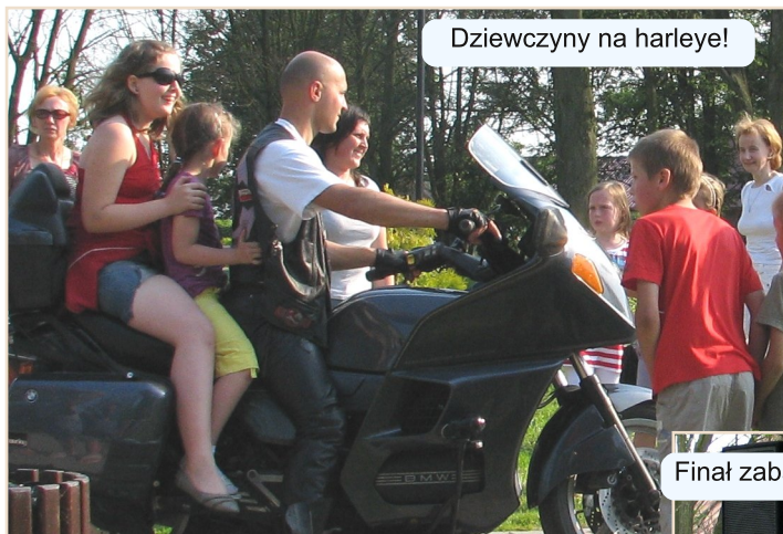
Dziewczyny na harleye!