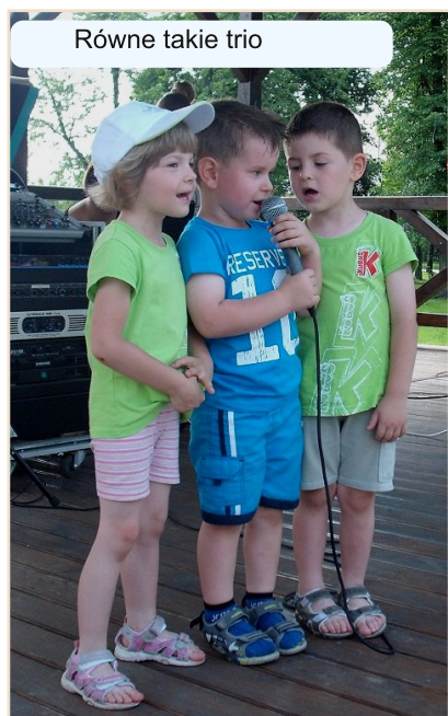
Równe takie trio