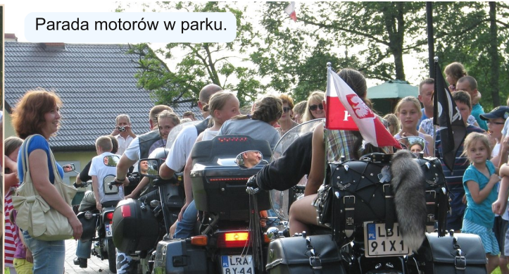
Parada motorów w parku.