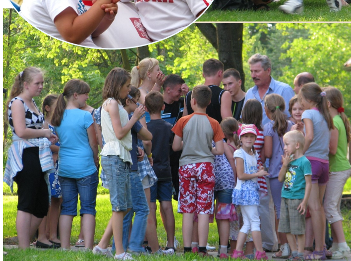
Tłumek po autografy zgromadził się wokół gimnastyków.