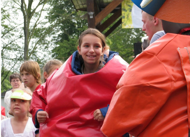
Dziewczyny obiecywały bezpardonową walkę.