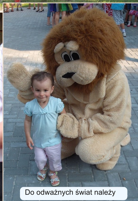
Do odważnych świat należy