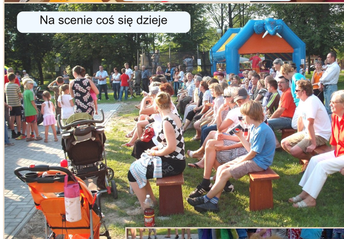
Na scenie coś się dzieje