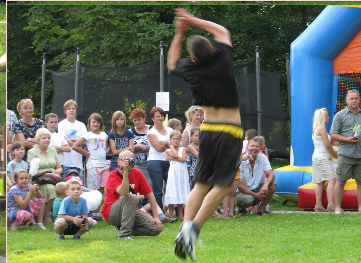
Ich pokaz był prosty i efektowny