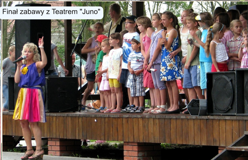
Finał zabawy z Teatrem "Juno"