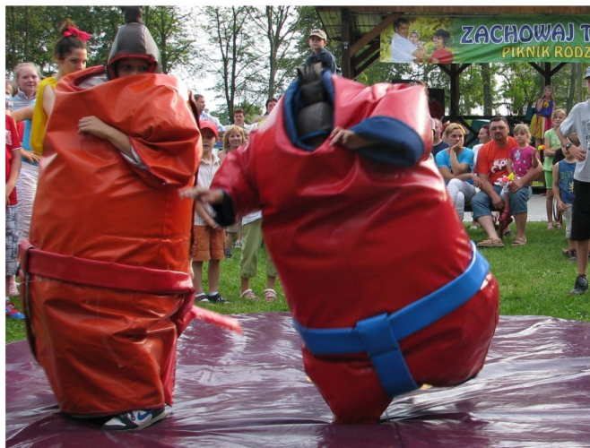
Często jednak do zwycięstwa prowadził czujny unik.