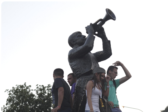
Pomnik trębacza na placu w Guczy

Spotkaliśmy się w Belgradzie (dojeżdżaliśmy tam z różnych miast, a nawet państw), czyli stolicy kraju, ale samo zwiedzanie miasta zostawiliśmy sobie na koniec naszej wyprawy. Udaliśmy się natomiast do Guczy, czyli niewielkiego, bo liczącego zaledwie dwa tysiące mieszkańców miasteczka w centralnej części kraju. Pojechaliliśmy tam bynajmniej nie po to, aby zobaczyć jak wygląda życie na serbskiej prowincji, bowiem na kilka sierpniowych dni Gucza zamienia się wielotysięczne miasto żyjące w rytmie muzyki orkiestr dętych. Festiwal trąbki Gucza ma już ponad półwieczną tradycję i właściwą dla swojego stażu renomę wśród orkiestr, które przyjeżdżają tam z całej Serbii, Bałkanów, a nawet i świata. W ślad za nimi zjeżdżają się oczywiście turyści. Szacuje się, że przez kilka festiwalowych dni przez Guczę przewija się nawet 300 tysięcy osób!