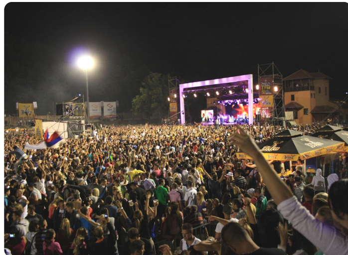
Finałowy koncert festiwalu zgromadził ogromną publikę

wykonujących ten rodzaj muzyki można wymienić Gorana Bregovica, który w Serbii również jest gwiazdą, występował też zresztą na Guczy . Muzyka orkiestr dętych prezentowana na festiwalu jest bardzo żywiołowa i energiczna, dlatego też cieszy się ogromną popularnością wśród Serbów różnych pokoleń, którzy potrafią zaśpiewać słowa do większości utworów tańcząc przy tym kroki swoich narodowych tańców.