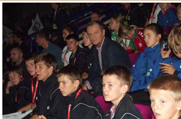
Drużyna z Łomaz obserwowała mecze finałowe siedząc na trybunach w towarzystwie premiera Donalda Tuska.

Sukcesem zakończył się Wojewódzki III Turniej Orlika o Puchar Premiera Donalda Tuska w Puławach. W tym roku w Finale Wojewódzkim wystąpiły zarówno dziewczęta jak i chłopcy z rocznika 1999-2000 (VI klasa szkoły podstawowej i I klasa gimnazjum). Dziewczęta zajęły III miejsce. Chłopcy zostali mistrzem województwa lubelskiego gromiąc w wielkim finale drużynę z Łęcznej w serii rzutów karnych 5:4. Najlepszym zawodnikiem turnieju został bramkarz łomaskiej drużyny Mikołaj Lewkowicz.