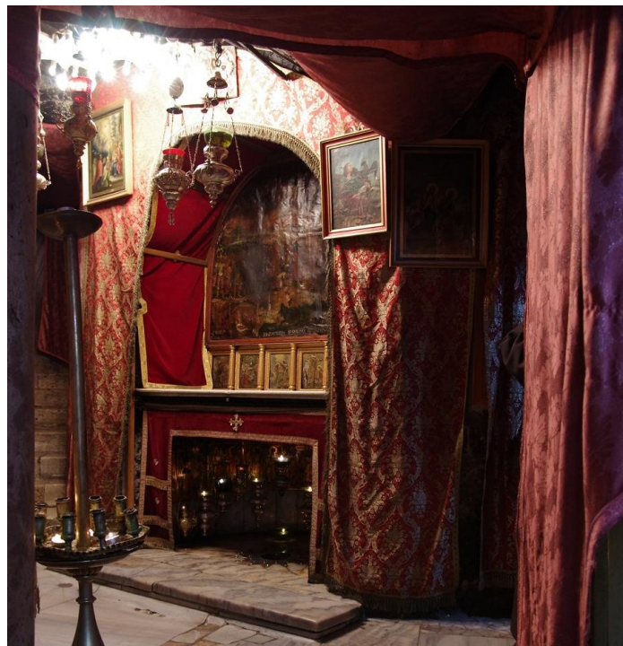
Na zdjęciach - Kościół Narodzenia w Betlejem