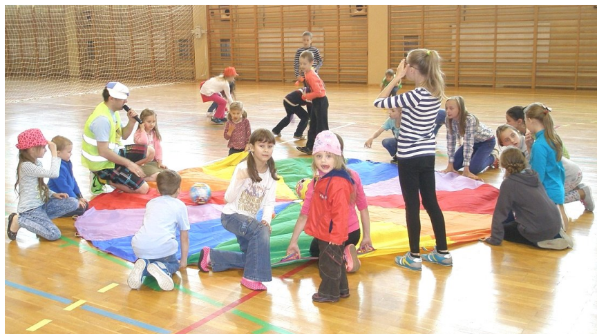
Na Dzień Dziecka - FanTomasz

Jacek Kaczmarski - Modlitwa o wschodzie słońca