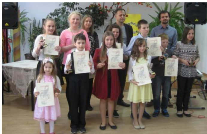
Konkursowi laureaci w towarzystwie konkursowych jurorów

Organizatorem imprezy był GOK i Gminna Biblioteka Publiczna w Łomazach.