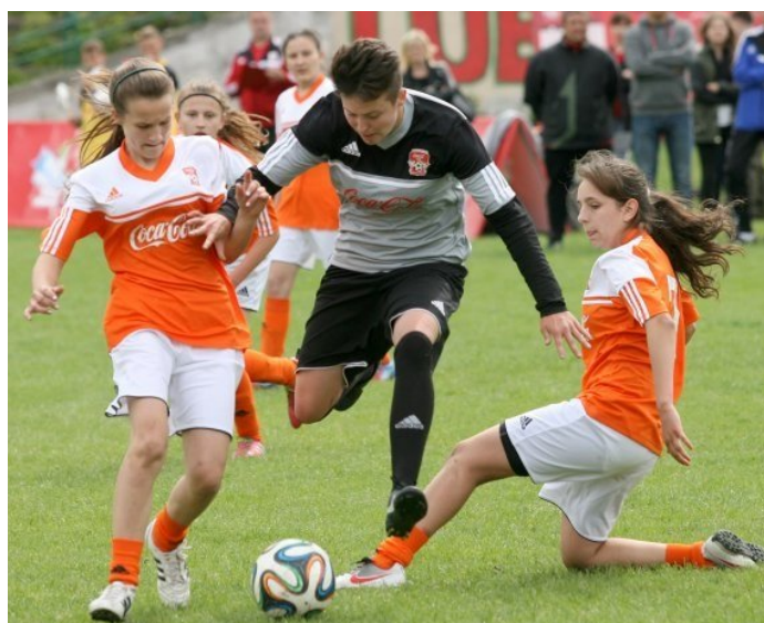
CCCup - Lublin - Mecz finałowy z Gimnazjum nr.16