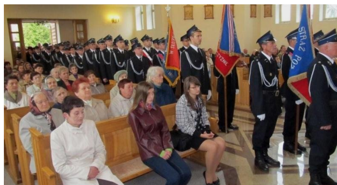
Uroczystości w Dubowie