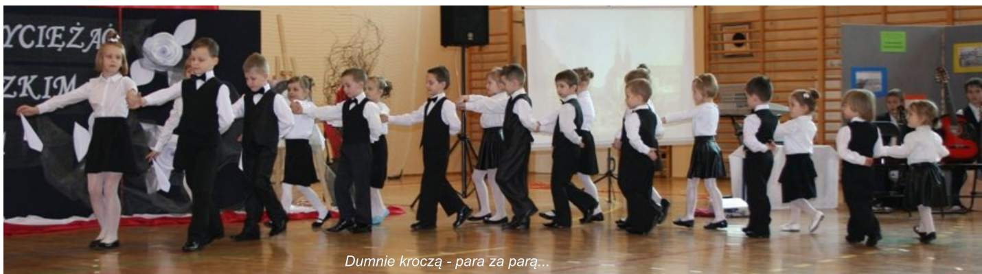
Dumnie kroczą - para za parą...