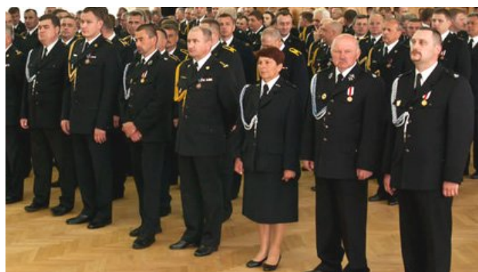
Biała Podl. - Ceremonia wręczania odznaczeń

Wręczono również inne odznaczenia strażackie.