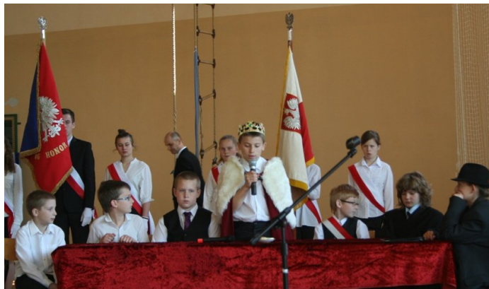
Wiwat Król...! Wiwat Sejm, wiwat Naród, wiwat wszystkie Stany!