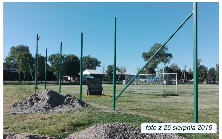
foto z 26 sierpnia 2016

Problemem łomaskiego stadionu, z racji położenia na niskim terenie, była często stojąca na murawie woda. Piłkarze NIWY musieli zatem niejednokrotnie rozgrywać mecze na wynajmowanych odpłatnie obiektach znajdujących się w innych miejscowościach.