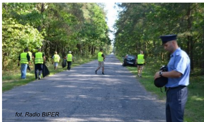
fol. Radio BIPER