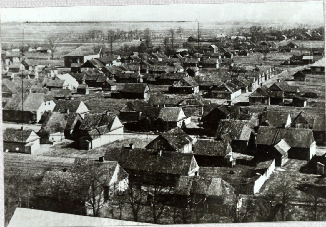
Widok z lotu ptaka na Łomazy - 1944 r.