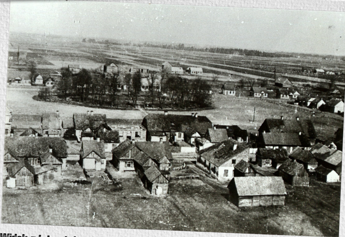
Widok z lotu ptaka na Łomazy - 1944 r.